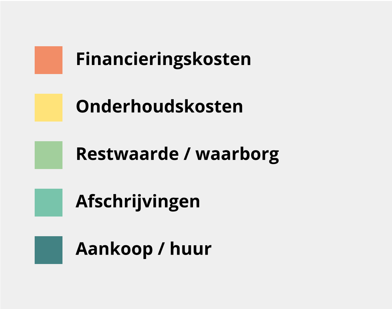
CIRCULAIR MODEL LEASEN VAN STOELLEN